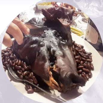
cūkas šņukurs - šņukurīts

Lai duršu, kur duršu, Durš` krāsnes podā.