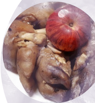
cūku kājiņas – cimboļi

Es tai nama saimēniecei Dižu prieku pasaciš': Duj' laivīnas jēru nāce, Trešā maģu suvēnīn'. Sasāgrieza ķekātīnas istubīnas dubenā; Sāgriez, Dievīn, rudzus miežus Saimēnieka druvīnā.